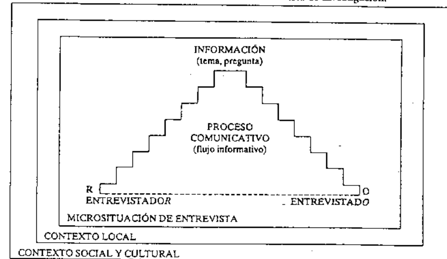
CUADRO 6.2. Modelo contextual de la entrevista de investigación.

Gorden representa, gráficamente, este modelo trazando una circunferencia (con la que simboliza la macrosituación : la contextualización a escala local, social, cultural). Dentro de este gran círculo se halla la microsituación de la entrevista, cuya definición por parte del entrevistador y el entrevistado dependerá de una serie de factores psicosociales que afectan, favorable o negativamente, al proceso comunicativo. Una adaptación gráfica de esta descripción se ha hecho en el Cuadro 6.2.