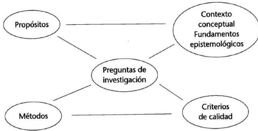
Gráfico 2.1. Modelo interactivo del diseño en la propuesta de investigación cualitativa